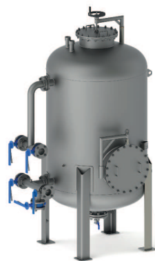
*Ilustração Aço inox

Todos os filtros leito Laffi, são projetados para atenderem a norma NR-13 e seguem com Data-book.